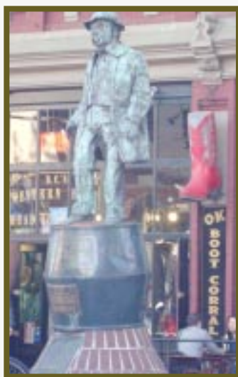
Gassy Jack, en su honor la zona de Gastown.