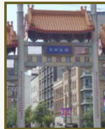
Entrada al barrio chino.

Aquí, destaca el famoso Steam Clock , reloj de vapor, que funciona con el vapor generado por el sistema que solía calentar a los bloques de