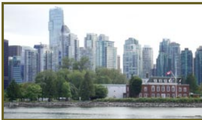
Vancouver, "la ciudad de cristal".

su diversidad en rico mosaico de gente y cultura de todo el mundo.