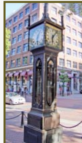
El famoso reloj de vapor.