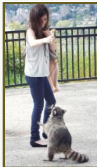
En cualquier momento puedes convivir con animales.

Cenamos en Un , en Granville St. , con espectaculares vistas de Granville Island y False Creek ... Al otro día recorrimos Granville Island , una zona llena de bares, restaurantes, tiendas y un enorme