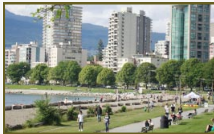
Una ciudad rodeada de jardines y montañas.