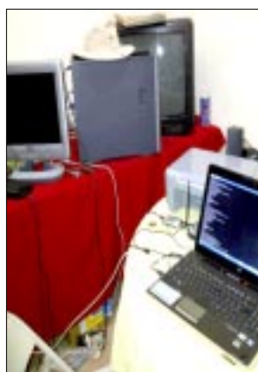
Estos equipos de computación fueron incautados en Chiapas.